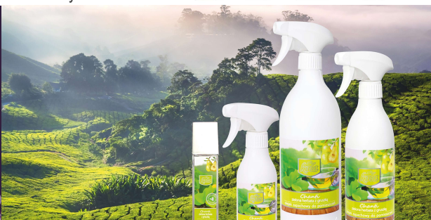
Zelený čaj s hruškou