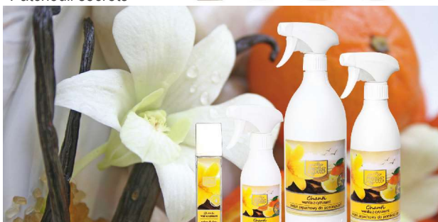
Vanilka s citrusmi