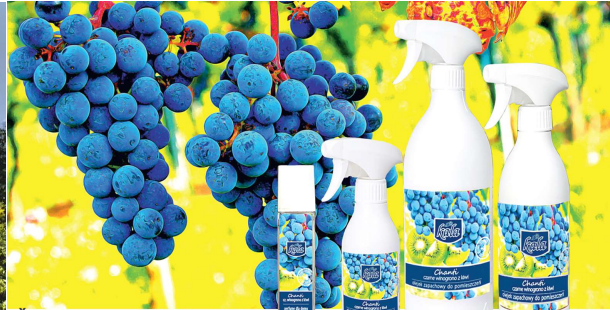
Čierne hrozno s kiwi