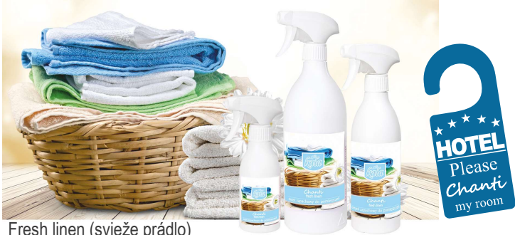
Fresh linen (svieže prádlo)

Oleje radu Chanti veľmi často používajú zamestnanci room service v hotelových apartmánoch, a môžu tiež slúžiť ako alternatíva k elektronickým osviežovačom vzduchu. V hustej premávke (toalety na diaľniciach, autobusy s turistami, organizované skupiny atď.) je elektronický systém nespoľahlivý, pretože frekvencia osvieženia bola nastavená podľa priemerného počtu osôb v miestnosti. Ďalším príkladom sú organické odpady a zvieracie pachy. Je ťažké odstrániť zápach zvratkov v toalete alebo pach zvierat v izbách. Vtedy, na obnovenie čistoty a vône, sa používajú naše oleje, ktoré slúžia na neutralizáciu nepríjemného zápachu a príjemne osviežujú miestnosti po dobu 1 až 2 dní po ich použití.